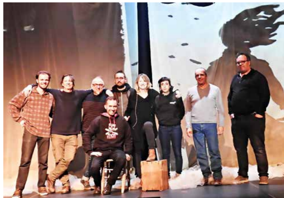
Team de création avec l'équipe du TJV 11/23

Cette élaboration minutieuse traduit l'ADN artistique de la compagnie, une démarche tissée sur le long terme, sous forme d'aller-retour, entre artistes, publics et scènes.